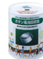
ボタン電池回収缶