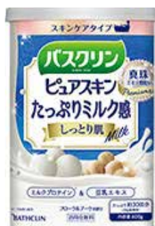
リニューアル4品(左) 『ピュアスキン』〈プラチナの輝き〉