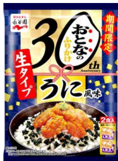
『おとなのふりかけ うに風味』198円（税抜価格）