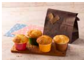
ヨーグルトカップケーキ

昭和産業では、お子さんたちによるこんででもらえるホットケーキづくりを心がけているママさんたちをサポートします。手軽でおいしく作れる『小麦粉屋さんのホットケーキミックス』、『いろいろ洋菓子が作れるホットケーキミックス』を大いに役立ててください。