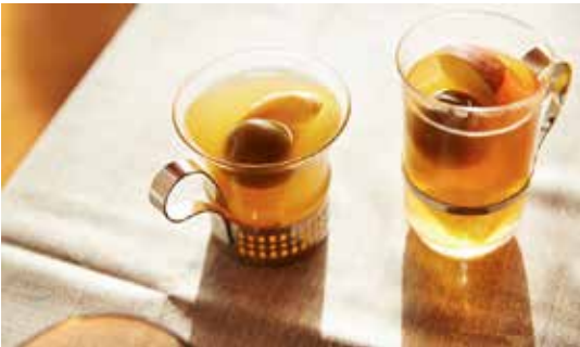
「梅酒のみぞれスープ餅」