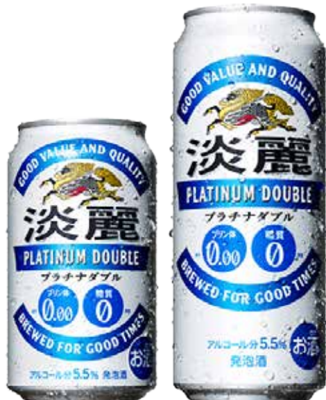
『淡麗 プラチナダブル』 350・500mL 缶*オープン価格

キリンビールの『淡麗 プラチナダブル』で、おいしさと安心感を、飲みすぎないように楽しみましょう