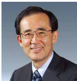
白川方明日銀前総裁

それまでデフレによって体力を奪われていた「日本経済」は自由民主党が政権を奪還して安倍晋三首相が「日本を取り戻す!」と呼びかけるたびに破竹の勢いで進撃を始めます。