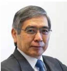
黒田東彦日銀総裁