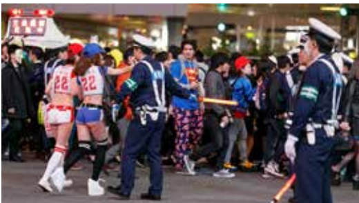
渋谷のハロウィン一部暴徒化で犯罪多発