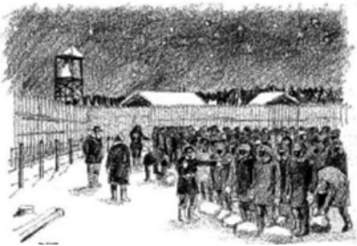
シベリア抑留 強制労働