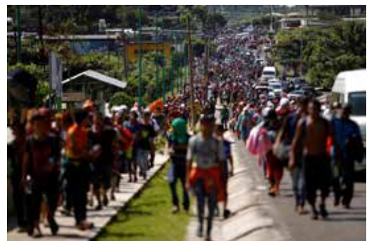
中米移民の集団北上

性に見えるらしく、白夜の夜遅く帰宅しようとする女性の後をつけ、襲い、強姦して、殺害し、ゴミ捨て場に放置する、という事件が多発している。