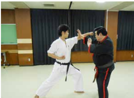
○左上段突きを右手刀払受け