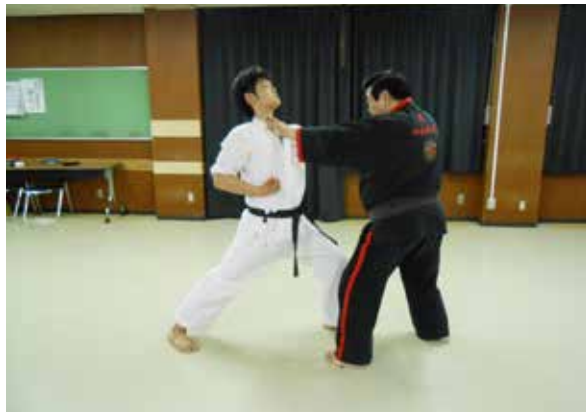
○すかさず喉に二本指貫き手