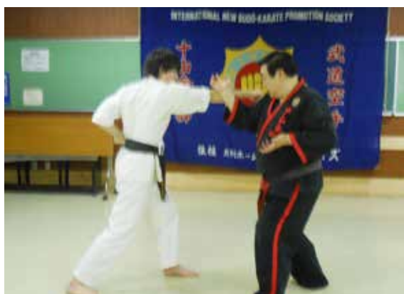
○右上段逆突きを右内掛け受けし、中段の急所へ前蹴りで決める。