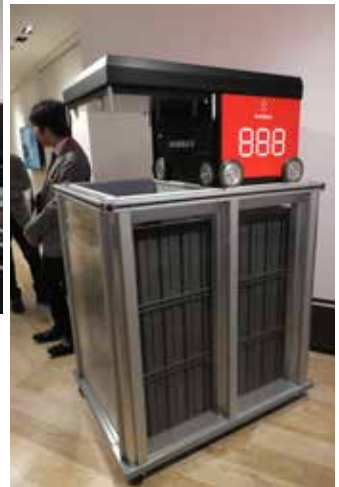
流通サポートAIロボット (上)