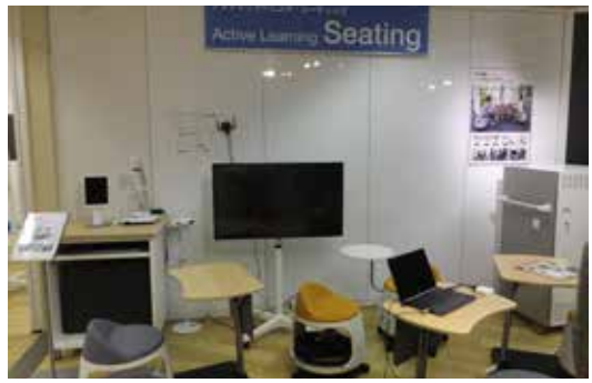
教員の働き方改革。教室にいる時間が増やせ生徒とのコミュニケーションづくりが図れる (上)

医療施設・研究施設など様々な場所で活動をサポートする器具やファニチュア満載の展示会でした。