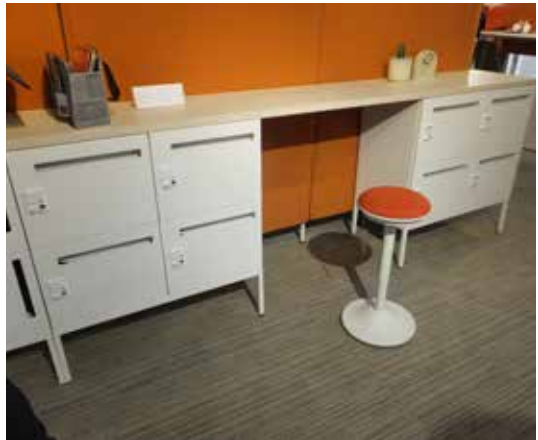
働きやすいオフィス環境づくりに欠かせない「Lives」強化と収納システム「モバイル収納シリーズ」(上) ジウジャーロデザインとコラボのオフィスシーティング「Finora」(下)