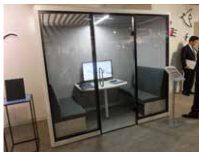
最高の集中環境をもたらす、フルクローズ型のワークブース「スノーハット」