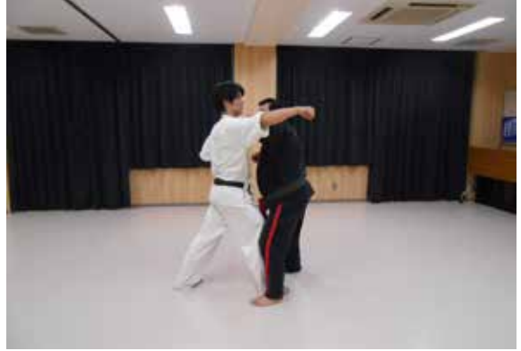
○上段突きを体捌きながら外鉄槌払受け