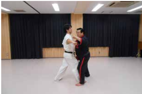
○すかさず右鍵突き