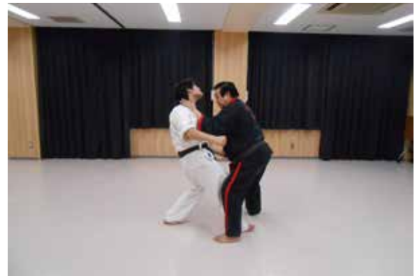
○さらに無双縦手刀できめる