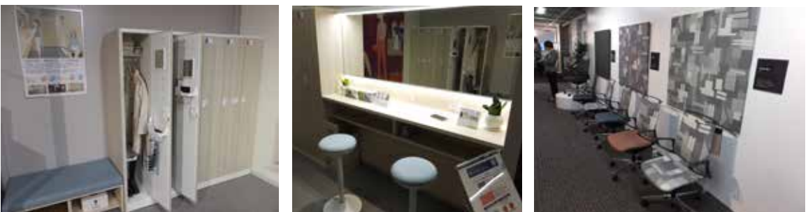
働き方改革の提案製品：オフィスファニチュア『ライブス』、ドレッシングスペースファニチュア『レスピア』と素材からの提案「CMR」の展示。