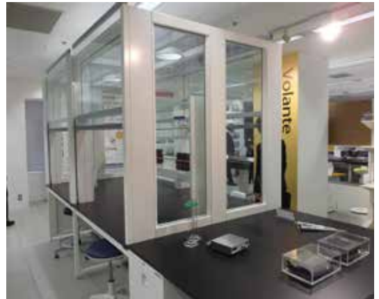
実験台用卓上フード 『アーケード』