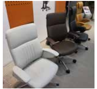
エグゼクティブシーティング 『レジェンダ』