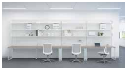
写真下左から 『フレスト』、『ソニックセイバー+G』、『アーケード』