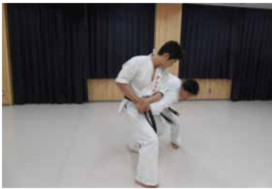
○体を反転し、腕を引きつけ投げて決める。