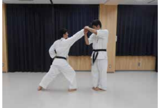
○右上段突きを素早く合わせどりし、