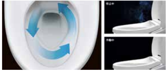
エアシールド脱臭