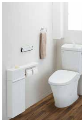
「アメージュZ便器（フチレス）」との組合せ（施工例）