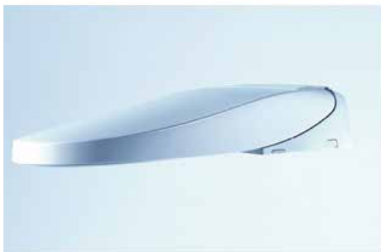
シャワートイレシートタイプ『New PASSO』

また、『New PASSO』の操作リモコン部には、LIXIL初の一般社団法人日本レストルーム工業会が今年の1月に策定した「標準ピクトグラム」を採用。日本のトイレメーカーがピクトグラムを統一することで訪日外国人を含め“だれでも安心して使えるトイレ環境”の実現を目指します。