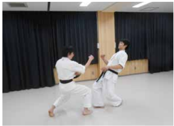
○着地と同時に突きを決める