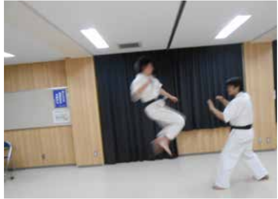
○虚をついて一気にジャンプ