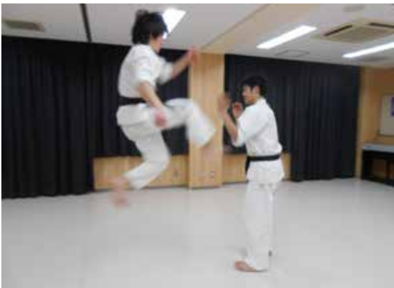
○右飛び蹴りを決める