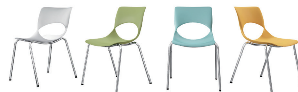
ミーティングチェア『Lutz (ルッツ)』(写真上)

●ミーティングテーブル『Feathery』は、軽量で軽快な操作感のミーティングテーブル。スリムなパイプ脚の機能性とデザイン性を両立した脚ブラケットを採用したことで、天板下の空間も広く使用可能。軽量化された天板で、フラップ操作が簡単、移動時も軽快でラクです。従来のオフィス空間にない自由なスタイルを実現します。