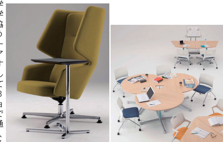
パーソナルロビーチェア『Conceal (コンシール)』(左)

●『Acti@Fellow』は、大学や図書館内の自習スペースで、学生が中心となり仲間や教員と協力しながらグループ学習を行うラーニングcommons向けのシリーズ。移動しやすく、様々なレイアウトが可能なテーブルと使いやすいホワイトボードをラインナップしました。テーブルは使用に応じて多彩な組み合わせが可能な(13形状29種類)天板バリエーションと4色のカラフル支柱も選択できる脚部との組み合わせで56通りのカラーバリエーションを揃え、多様化する教育スタイルにおける学生のアクティブな学習をサポートします。