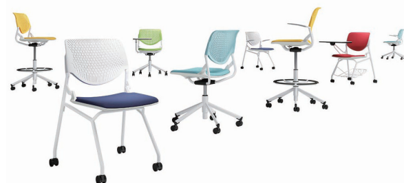
オフィスシーティング『mode (モード)』(写真左)