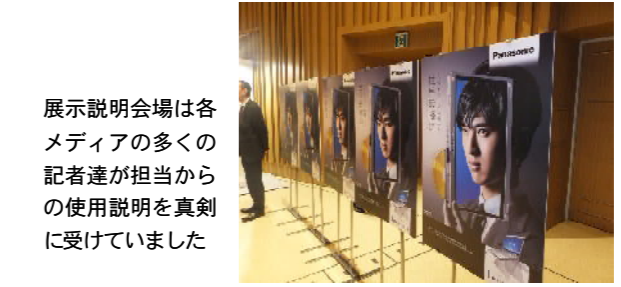
展示説明会場は各メディアの多くの記者達が担当からの使用説明を真剣に受けていました