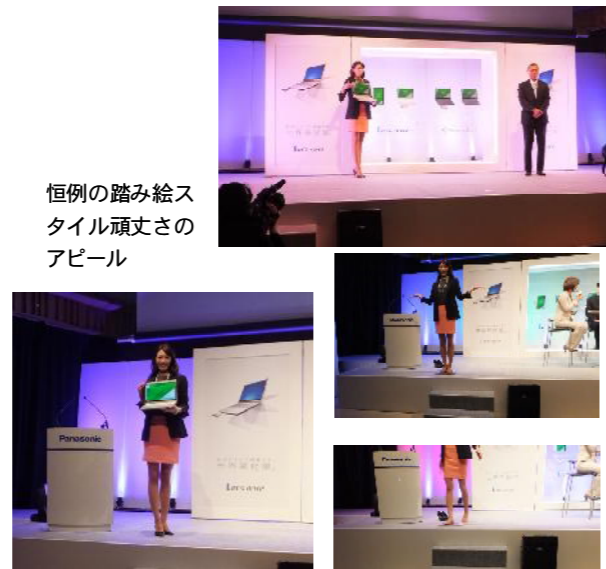
恒例の踏み絵スタイル頑丈さのアピール