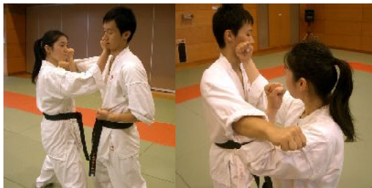
○引き受けと同時に裏拳で決める