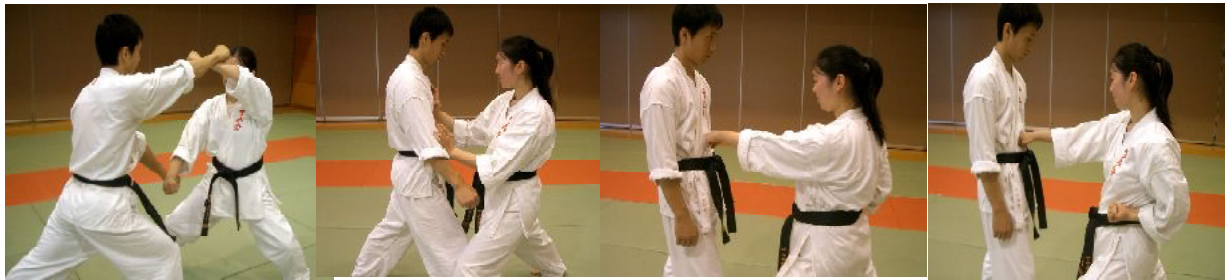
○山突きを上下で受け、すかさず逆立て手刀 ⇒ ○2連突きで決める