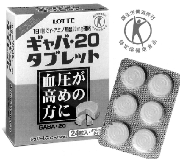
1箱24粒入り(6粒×4トレイ) メーカー希望小売価格1,500円(税込)

ヤクルトの『プレティオ』は1日当たりコストで120円だが、それでもロッテ電子工業の『ギャバ・20タブレット』の約2倍。圧倒的な価格差があります。